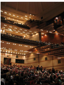
Sala Alexandra Trianti

Luna noiembrie a programat în Sala Alexandra Trianti a complexului Megaron din Capitala Greciei o serie de spectacole cu populara „Traviata”, având-o printre interpretele rolului titular, ca vedetă, pe renumita soprană Elena Moșuc, cea care a purtat personajul verdian în triumf peste tot în lume, îndeosebi prin prezențe memorabile pe marea scenă a teatrului Scala din Milano.