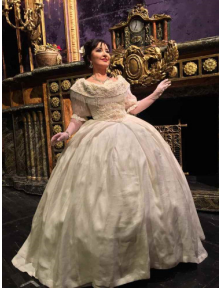
Elena Moșuc (actul întâi)

Alternanța unor asemenea secvențe cu rostiri lirice, subtile vine din capabilitatea sopranei de modelare a frazelor muzicale. Să nu uităm că Elena Moșuc este o desăvârșită belcantistă, unanim confirmată. Aici își au sorgintea minunatele desene melodice construite în crescendo, apoi în decrescendo pe același arc de respirație, precum și atacurile moi de sunet ale notelor înalte, înzestrări de expresivitate străbătute de trăire intensă, pasiune și dăruire în cânt. Nu trebuie uitate coloraturile perlate care abundă în marea arie din primul act, executate strălucitor și pregnant. După cum, nu trebuie uitat tradiționalul Mi bemol-ul acut al finalului acelei arii. Suplimentar, amintindu-și de o prestație a Mariei Callas într-un memorabil spectacol din Mexicul anilor '50, Elena Moșuc a încheiat concertato-ul de la sfârșitul actului al II-lea cu încă un Mi bemol acut pe care partitura nu-l conține și al cărui adaos este mai puțin potrivit atmosferei, dar domină spectaculos scena.